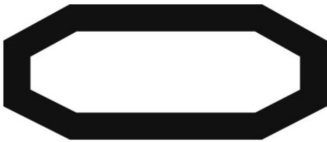
tipologia di crimpaggio per terminali