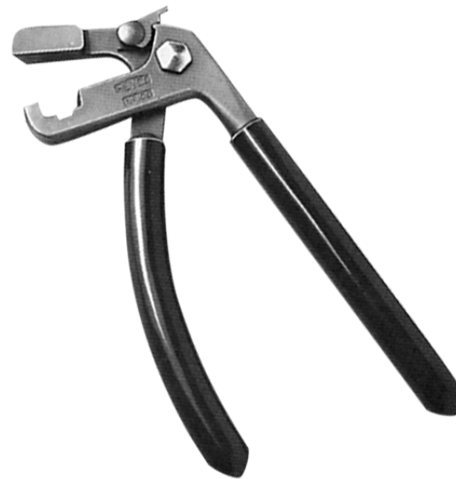
PINZA R 00XX