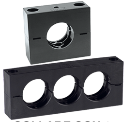
COLLARE CON 1 O PIU' FORI