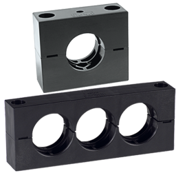
COLLARE CON 1 O PIU' FORI