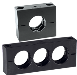
COLLARE CON 1 O PIU' FORI